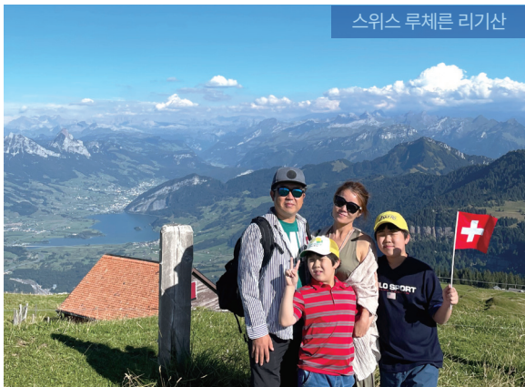
스위스 루체른 리기산

한 달씩 집을 떠나 사는 것은 생각보다 힘들다. 하지만 함께 문제를 해결하며 보낸 시간만큼 가족 간의 유대감이 깊어졌다. 외국인 친구에게 스스럼없이 말을 건네는 아이들 덕분에, 나 역시 현지 부모와 대화를 나누며 진땀 어린 추억을 쌓기도 했다. 여행이 아이들의 시야와 자신감을 키워주고 있다는 것을 느꼈다. 자녀 교육을 위해 시작한 ‘해외 한 달 살기’는 넓은 세상을 오감으로 느끼며 가족의 사랑을 깊이 쌓아가는 시간이었다. 그것이 여행이 우리 가족에게 준 가장 큰 선물이다.