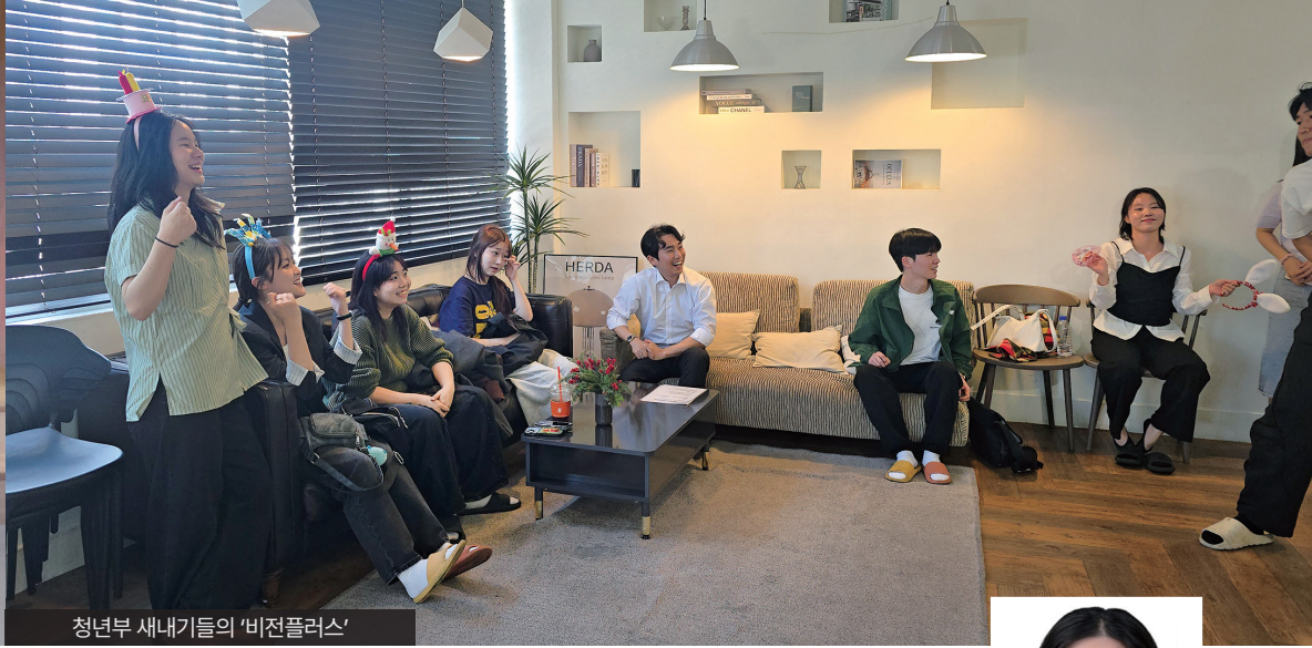
청년부 새내기들의 '비전플러스'