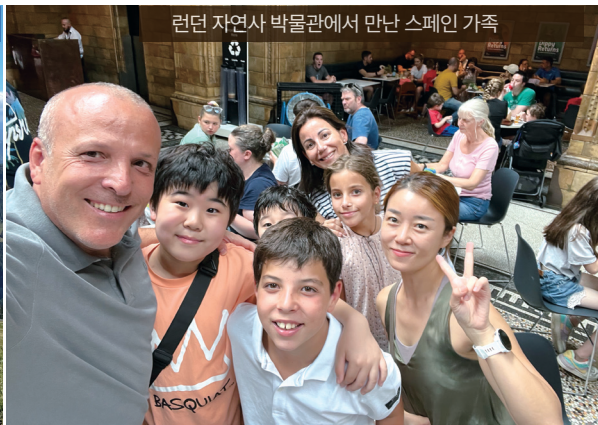
런던 자연사 박물관에서 만난 스페인 가족