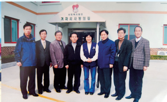
고아원 봉사 활동