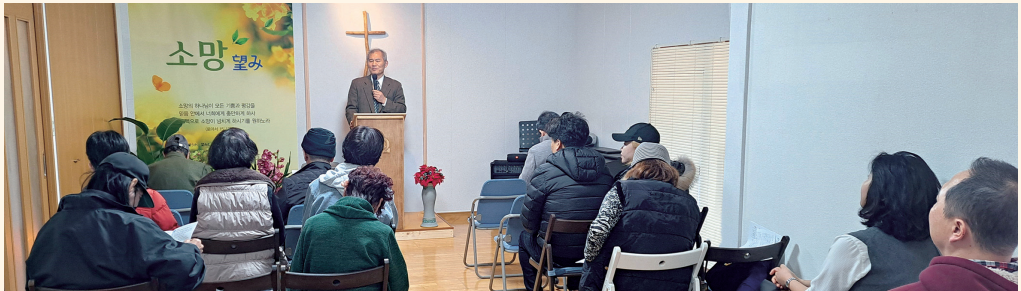
대마은혜교회, 새 예배당에서 첫 예배

지난 가을부터 대마도를 찾는 한국인 관광객들이 부쩍 늘어났습니다. 주말이면 이즈하라 거리가 한국인들로 가득 차서 마치 코로나 이전으로 돌아간 듯 북새통을 이룹니다. 한국인 거주자도 이미 180명을 넘어섰고 미얀마나 인도네시아 외국인 근로자들도 쉽게 만날 수 있습니다.