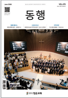
'맛나는 교회' 공개녹화